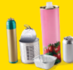
EMBALLAGES EN METAL