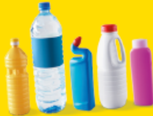
BOUTEILLES ET FLAONS EN PLASTIQUE