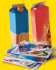
PAPIERS, EMBALLAGES ET BRIQUES EN CARTON