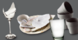
VAISSELLE EN VERRE OU EN PORCELAINE